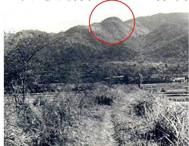
S20年代枚岡神社方面から神津嶽